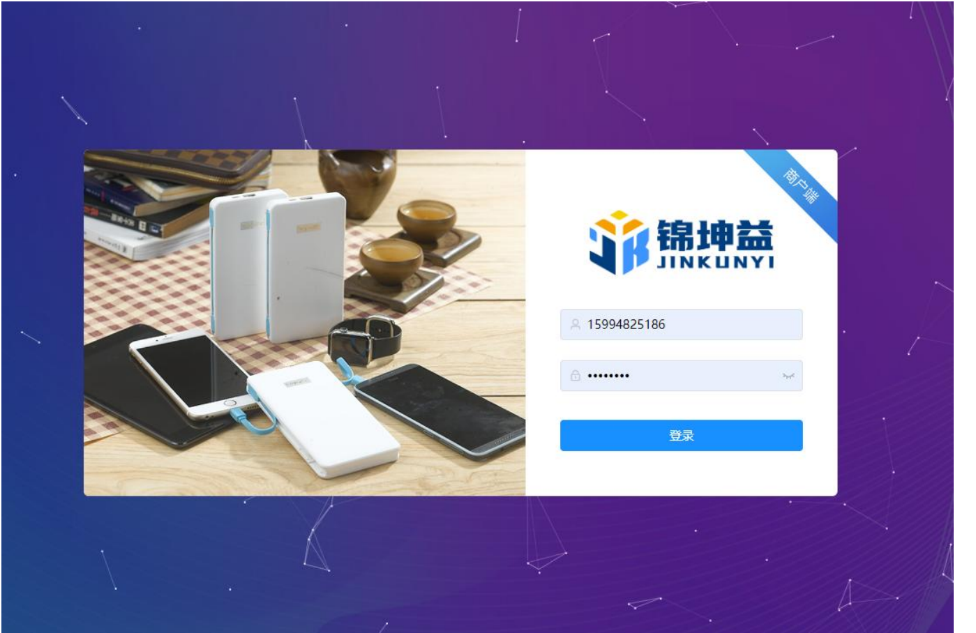
步骤图 3 (收到审核通过短信后, 点 B-2 绿色按钮登录)